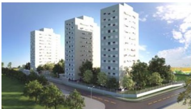
Projeto: Associação Irmã Lucinda Fonte: Plano de Trabalho