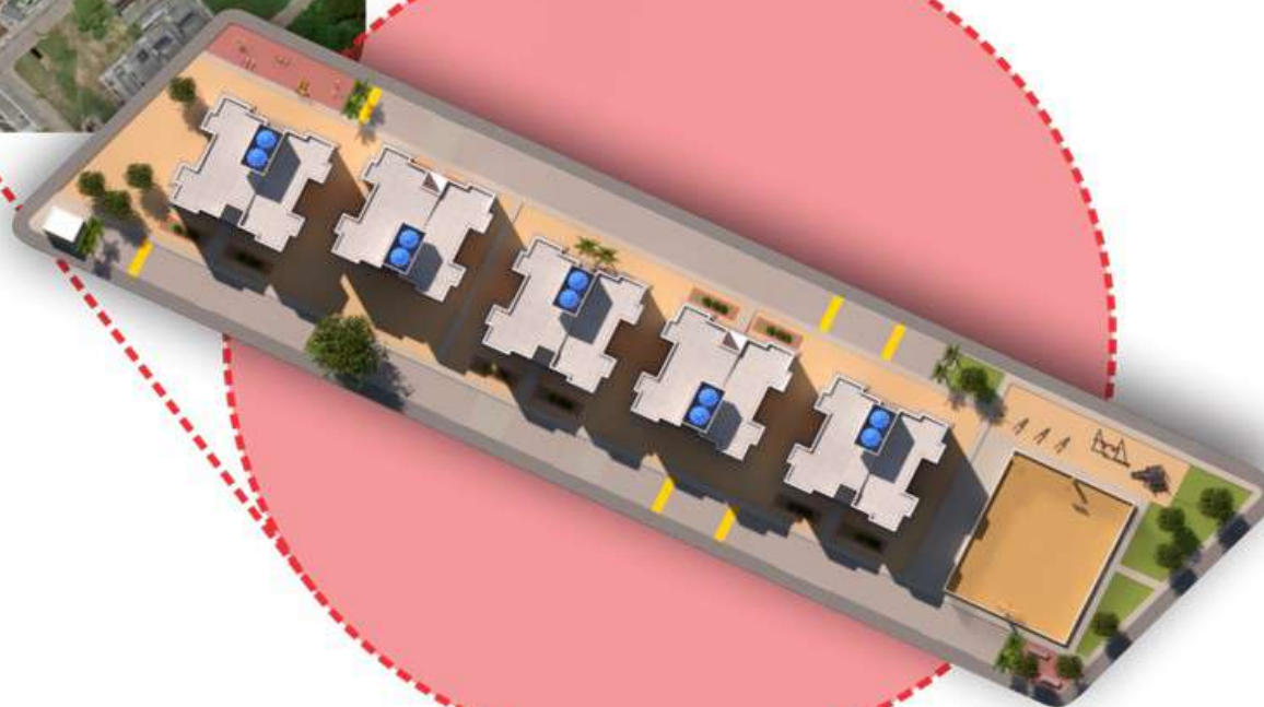
MUÇUMAGRO 80 U.H. SEM ESCALA