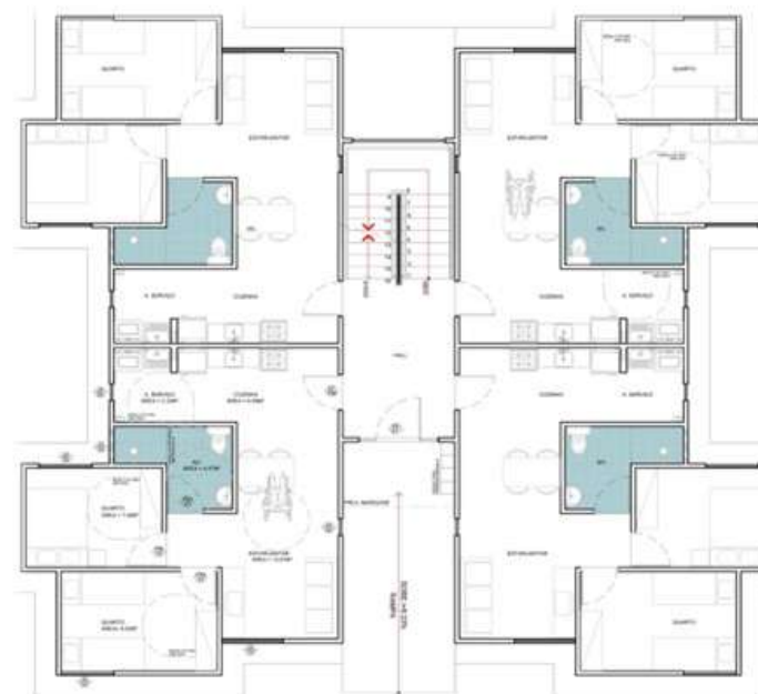
PLANTA BAIXA TÉRREO