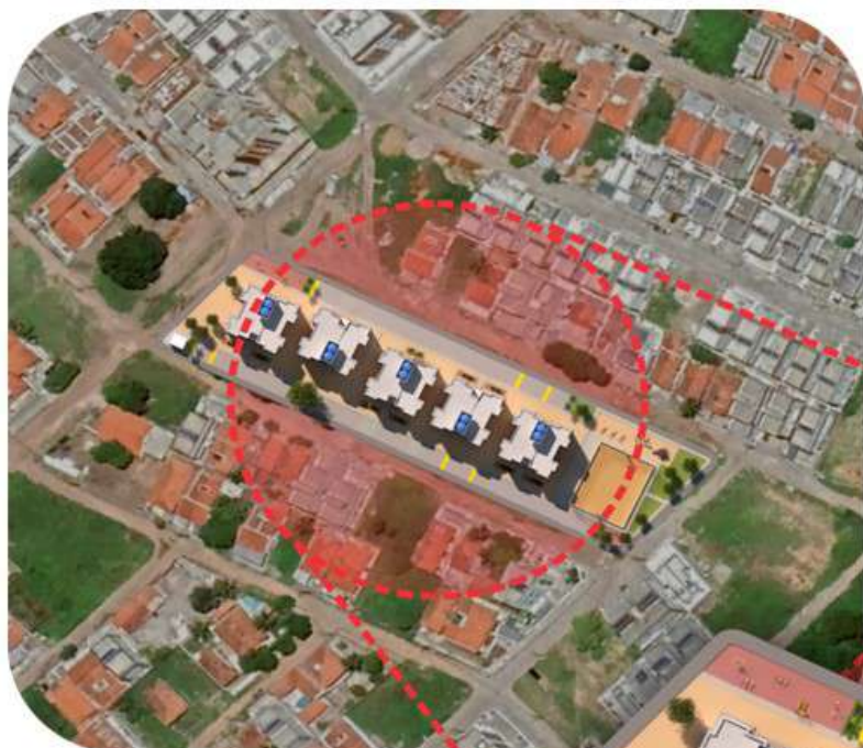
IMAGEM SATÉLITE MUÇUMAGRO SEM ESCALA

Rua Altemar Dutra – Muçumagro, João Pessoa – PB.