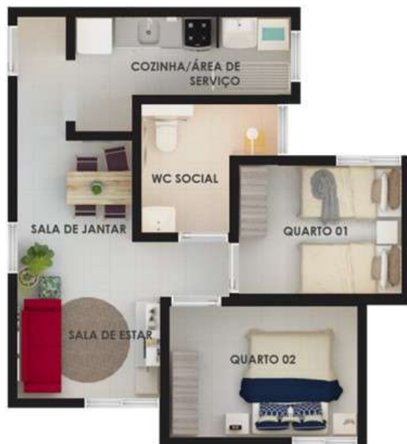
PLANTA BAIXA – APARTAMENTO TIPO