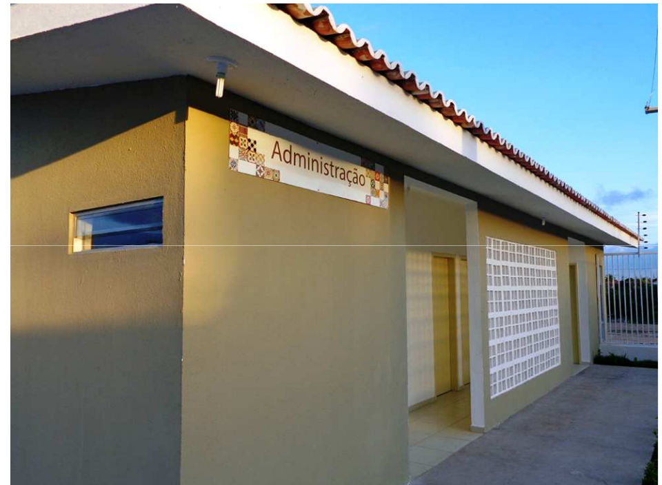
Guarita e Administração