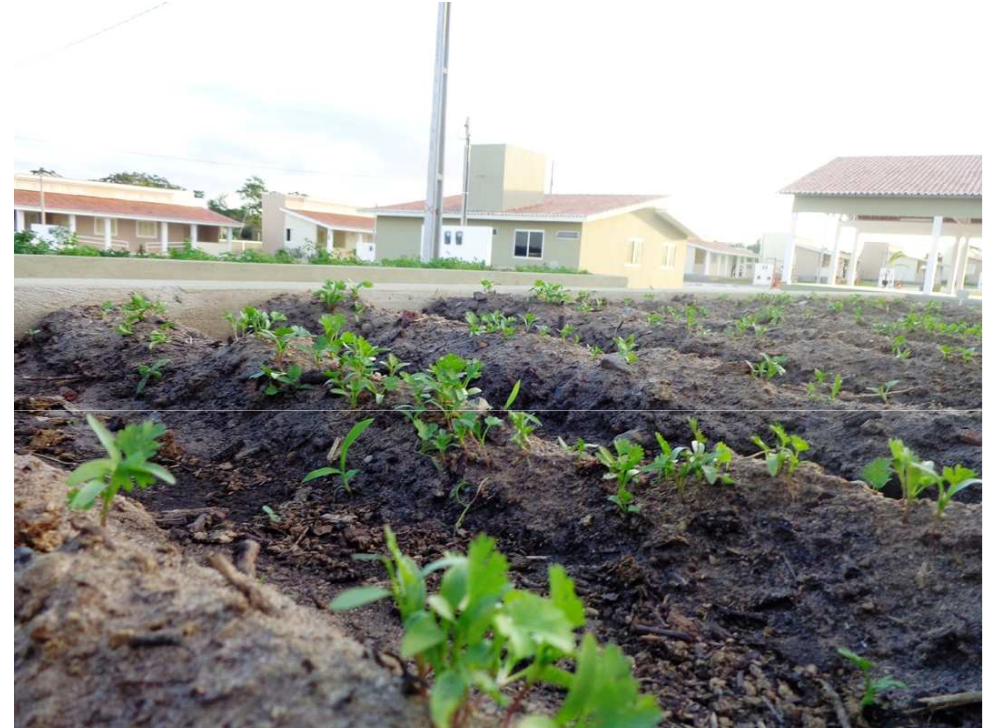
Horta comunitária: elevada e baixa