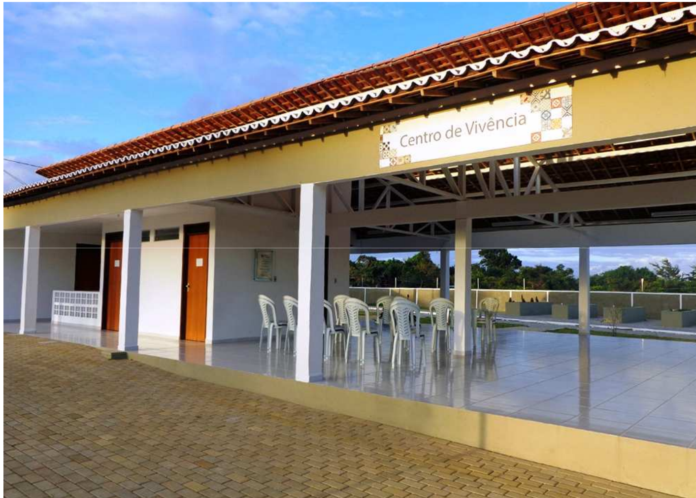
Centro de Vivência

Desenvolvido pela equipe técnica da Cehap