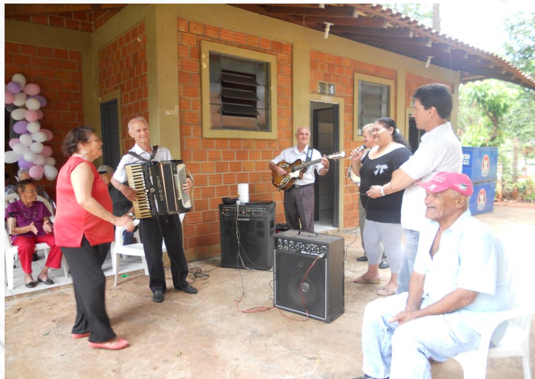
ANIVERSÁRIO DO CONDOMÍNIO DO IDOSO. DATA: 29/11/2012