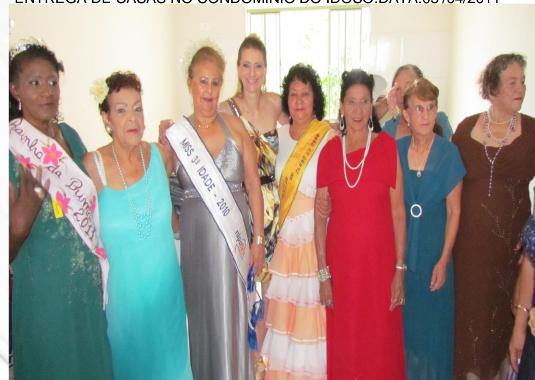
ANIVERSÁRIO DO CONDOMÍNIO DO IDOSO E MISS IDOSA. DATA: 10/10/2