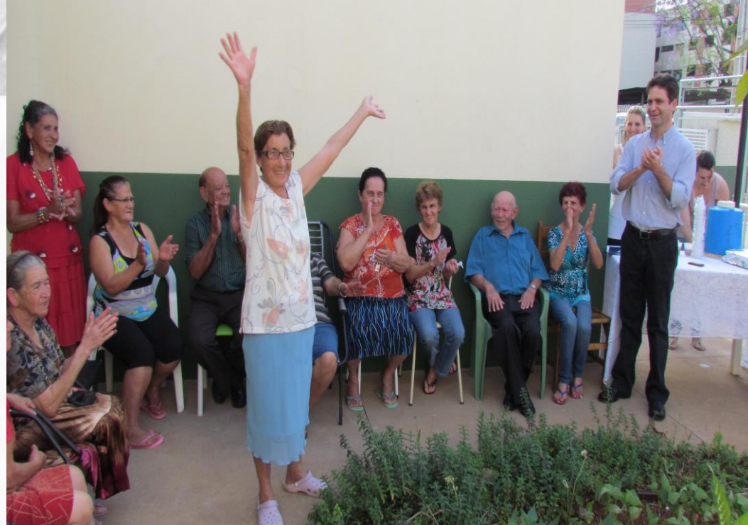
ENTREGA DE CASAS NO CONDOMÍNIO DO IDOSO. DATA:03 /04/2011