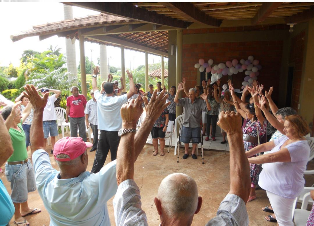
ANIVERSÁRIO DO CONDOMÍNIO DO IDOSO. DATA: 29/11/2012