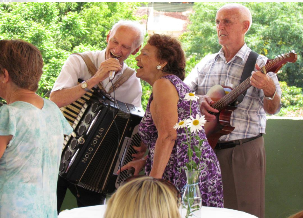
LANÇAMENTO PRÓ-IDOSO. DATA:03 /04/2011