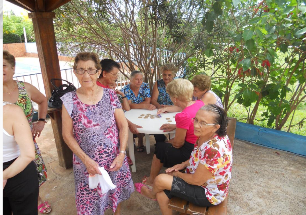
ANIVERSÁRIO DO CONDOMÍNIO DO IDOSO. DATA: 29/11/2012