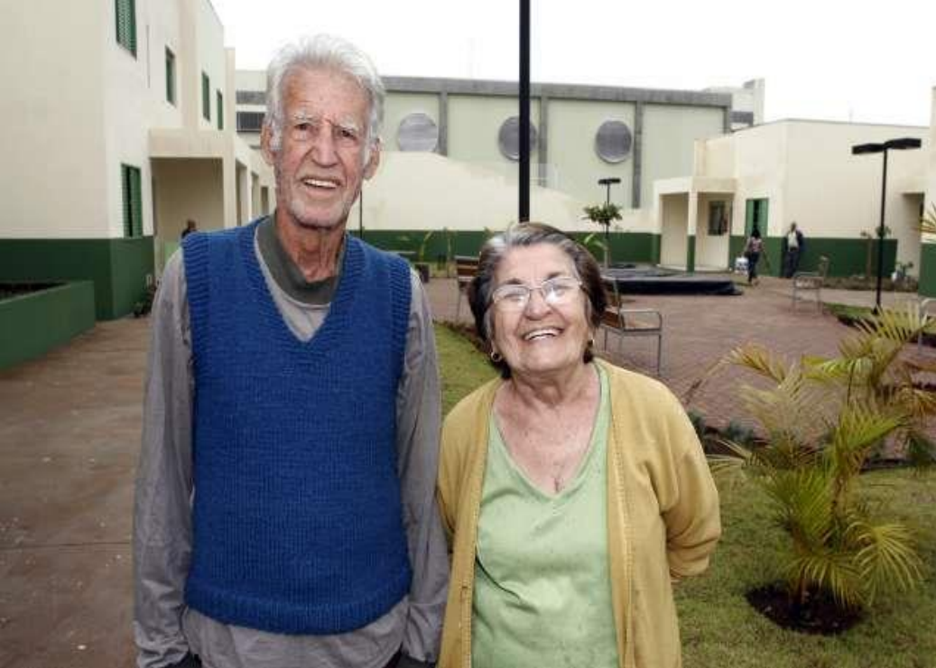
CONDOMÍNIO DO IDOSO. DATA:03 /04/2011