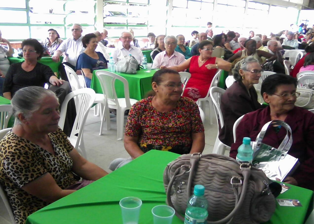
ANIVERSÁRIO DO CONDOMÍNIO DO IDOSO E MISS IDOSA. DATA: 10/10/2011