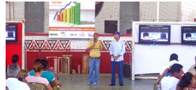
Apresentação do Plano Habitacional (fotos acima e abaixo).