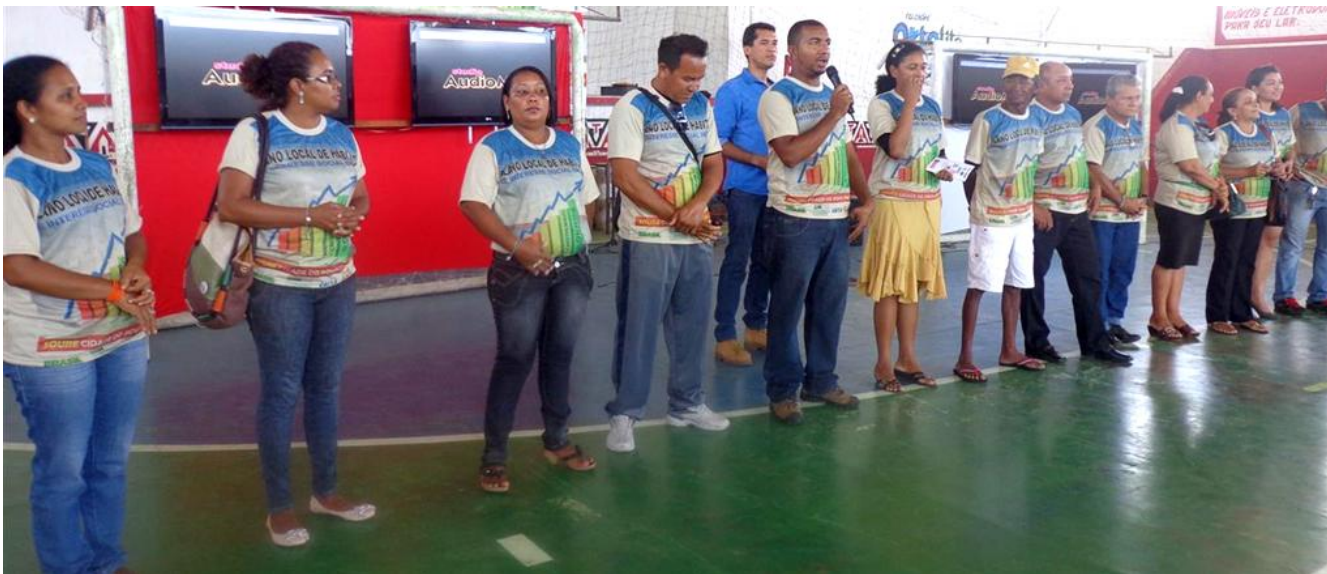
Equipe da Secretaria Municipal de Habitação e Conselho Gestor do Fundo Municipal na audiência pública para apresentação do Plano de Habitação.

A equipe da Secretaria Municipal de Habitação de Soure é bastante reduzida, formada pelo Secretário, Chefe de Gabinete, 3 assessores e 3 auxiliares. A equipe inteira envolve-se nas ações da secretaria, sendo o planejamento fundamental para a conclusão das atividades. Para conseguir alcançar os resultados e cumprir as metas, a equipe da Secretaria conta com o apoio e envolvimento do Conselho Municipal, das parcerias com outras secretarias e parcerias institucionais.