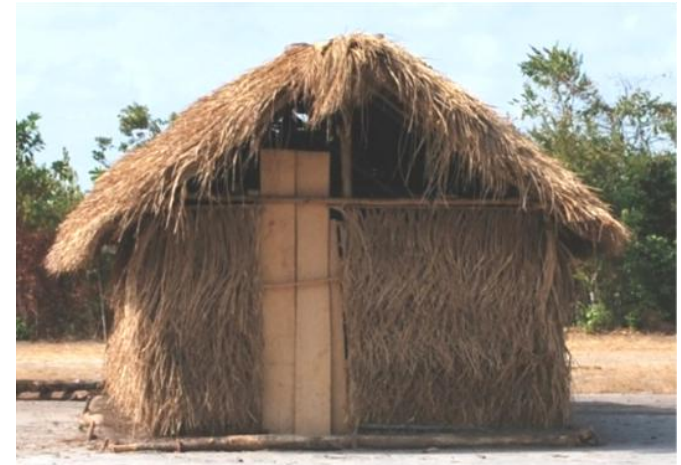
Os domicílios rústicos representam grande parte do déficit habitacional de Soure.

Em 2013, a instalação da Secretaria de Habitação e do conselho municipal proporcionou a construção de uma efetiva Política Habitacional em Soure , que adotou estratégias visando garantir a participação social e a transparência das ações públicas.