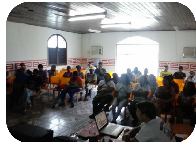
Prestação de Contas da Secretaria de Habitação em audiência pública