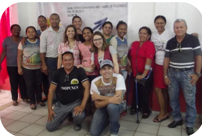
O Conselho Municipal de Habitação e a parceria com a COHAB/PA