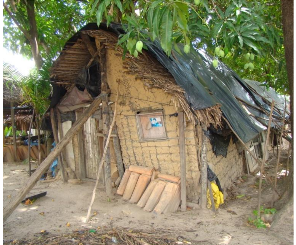
A situação de precariedade da moradia é critério de priorização para atendimento das famílias em Soure.