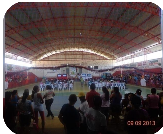
Divulgação do Plano de Habitação aos cidadãos de Soure/PA