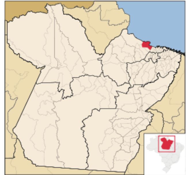
Localização geográfica de Soure no Pará.

No entanto, apesar das belezas históricas e naturais, Soure enfrenta também as dificuldades encontradas na Região do Marajó, que apresenta baixos índices socioeconômicos, estando entre as mais carentes regiões paraenses.