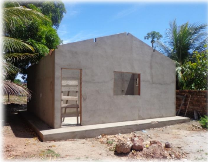
Moradia em construção com recursos do PNHU.