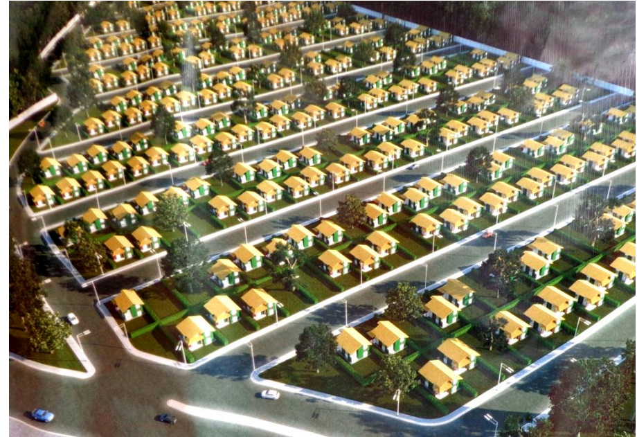
Maquete Eletrônica do Conjunto Residencial Pérola do Marajó, em fase de contratação, com a previsão de construção de 437 moradias com recursos do PNHU.