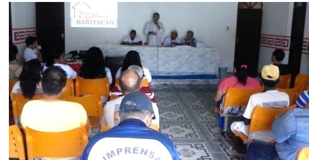
Prestação de Contas pública.

Envolver o cidadão e as organizações sociais na implementação da Política Habitacional é uma das principais estratégias da Secretaria Municipal de Habitação. Nesse sentido, foram realizadas audiências públicas para divulgação do Plano Habitacional, para Prestação de Contas Anual, bem como a Conferência Municipal da Cidade, coordenada pela Secretaria de Habitação.