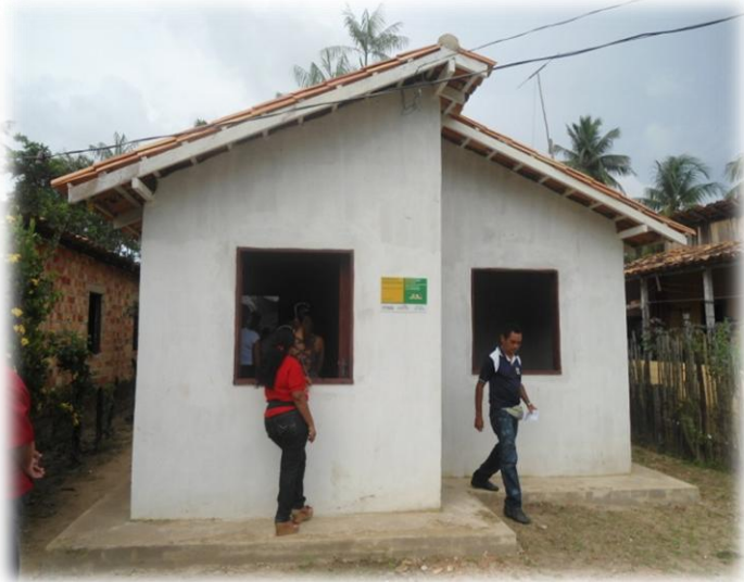
Moradia produzida com recursos do PNHU.