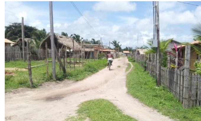
A carência de infraestrutura é o maior problema habitacional do município.