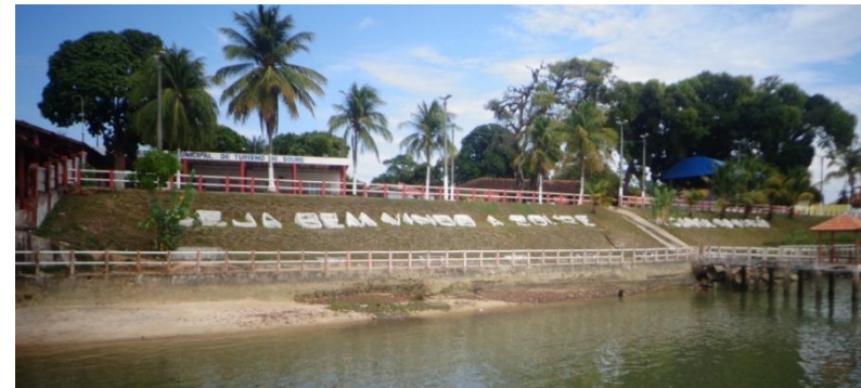
Vista da chegada da cidade de Soure.