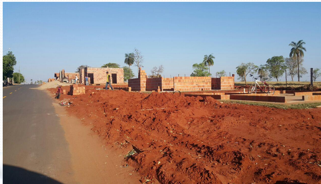
Autoconstrução em andamento- início