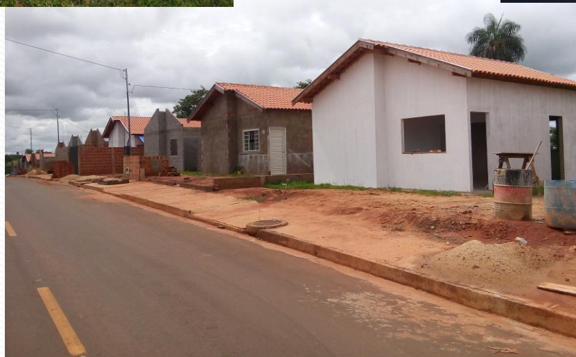
Autoconstrução em andamento com coberturas