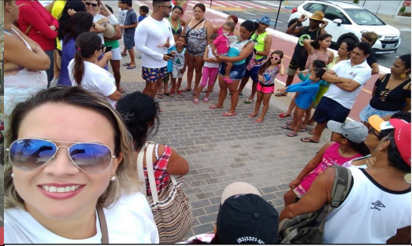
Ação Socioeducativa Ecopraia na praia de Tambaú, arquivo 2019.