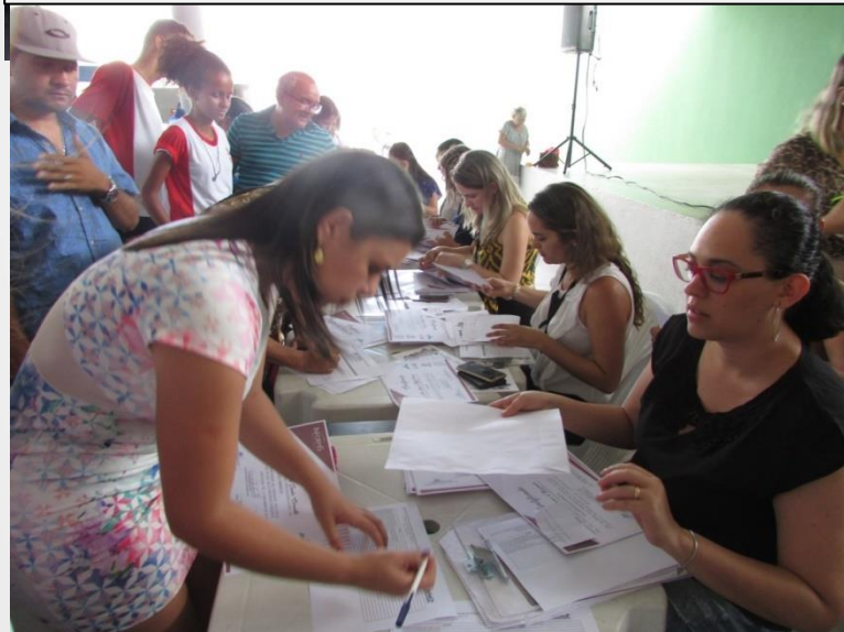
Evento entrega dos certificados, arquivo 2018.