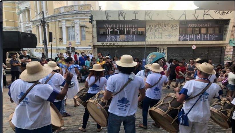
Aulão de Dança com Maracatu no Centro Histórico , arquivo 2019.