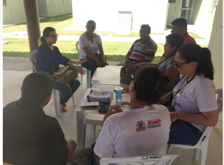
Plantão Social com Distrito Sanitário II e moradores, arquivo 2018.