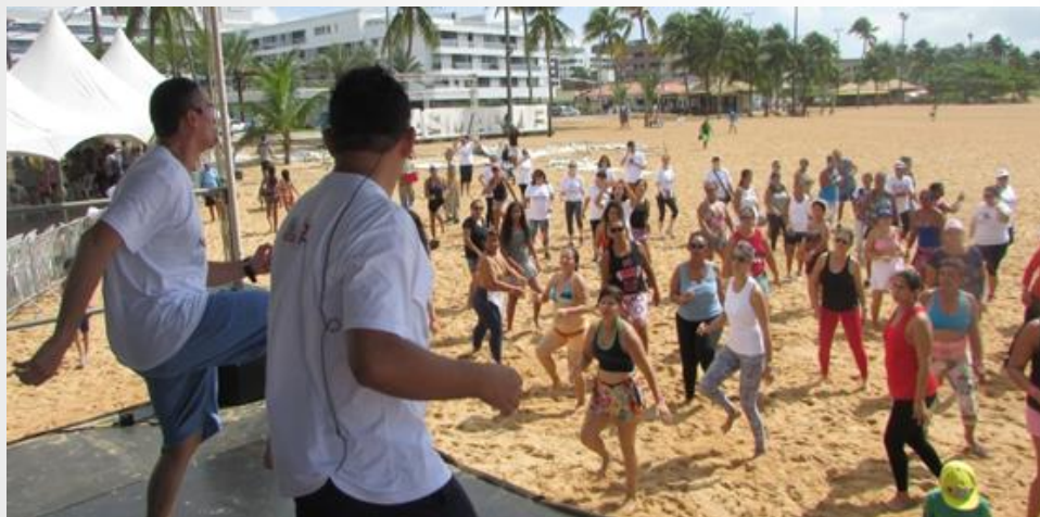
Ação Novo Lar Vida Saudável, arquivo SEMHAB – 2018.

Contribuir para a melhoria da qualidade de vida da população, estimulando a intersectorialidade de políticas públicas locais, o fomento ao convívio comunitário e a integração das pessoas ao seu território, de forma a ensejar efetivamente mudanças socioeconômicas, sustentabilidade social e estímulo a conservação da moradia e do meio ambiente.