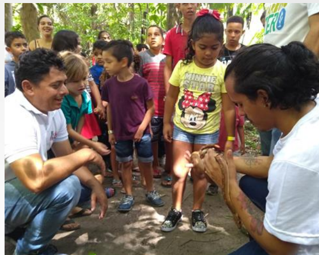
Passeio ecológico no zoológico, arquivo SEMHAB – 2019.