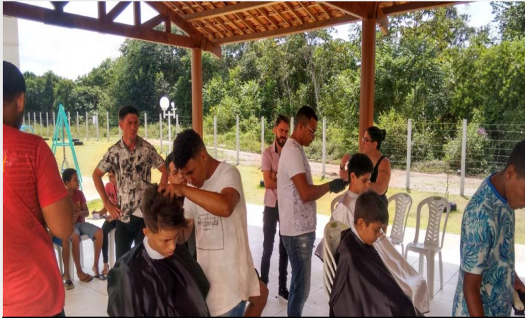
Curso Barbeiro, arquivo 2018.