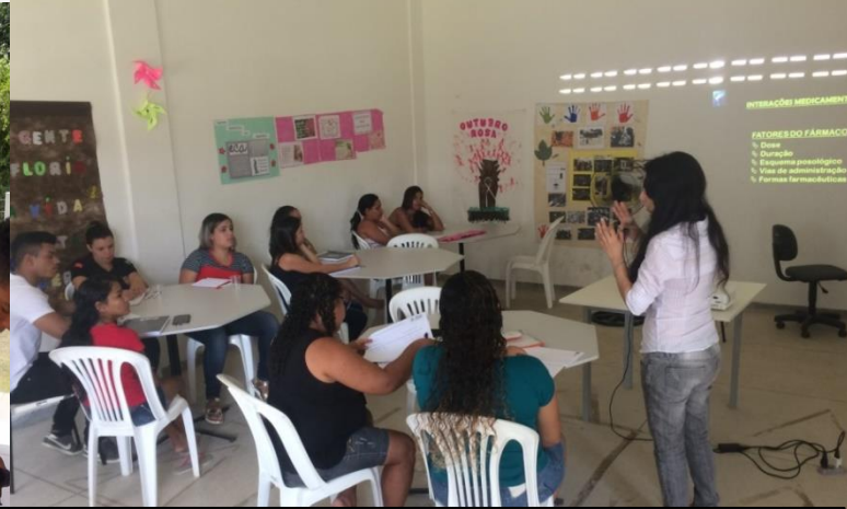
Curso Atendente de Farmácia, arquivo 2019.