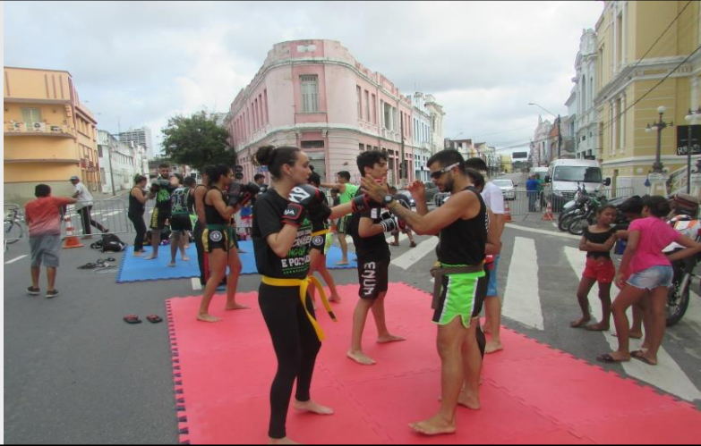
Oficina de Kickboxing no Centro Histórico , arquivo 2019.