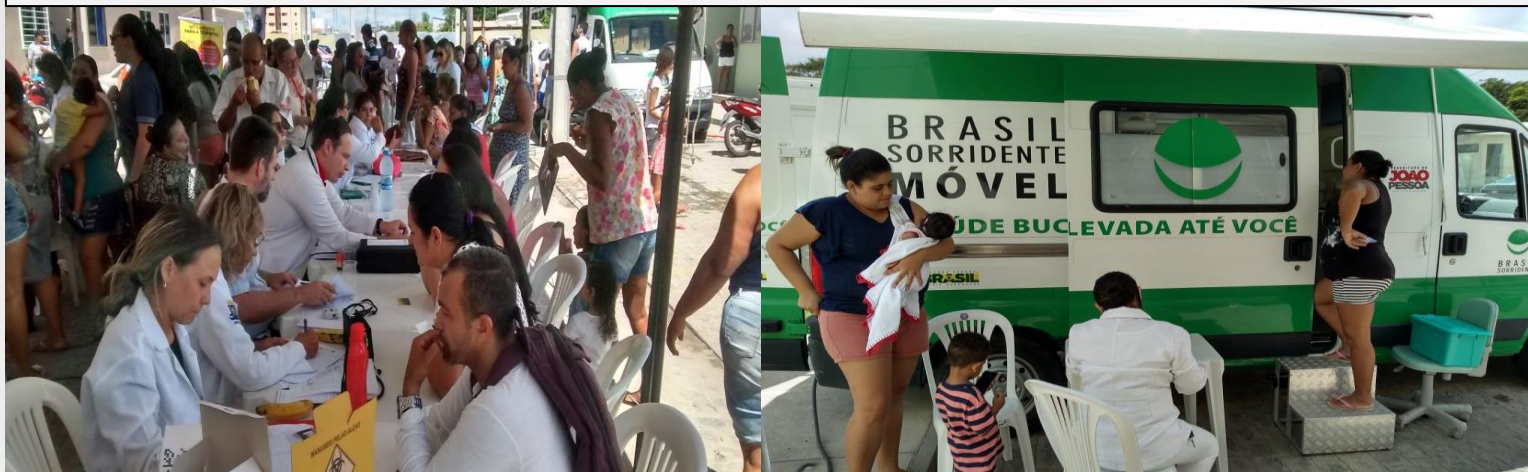
Ação de Saúde em parceria com DS II e USF Colinas II, arquivo 2018.