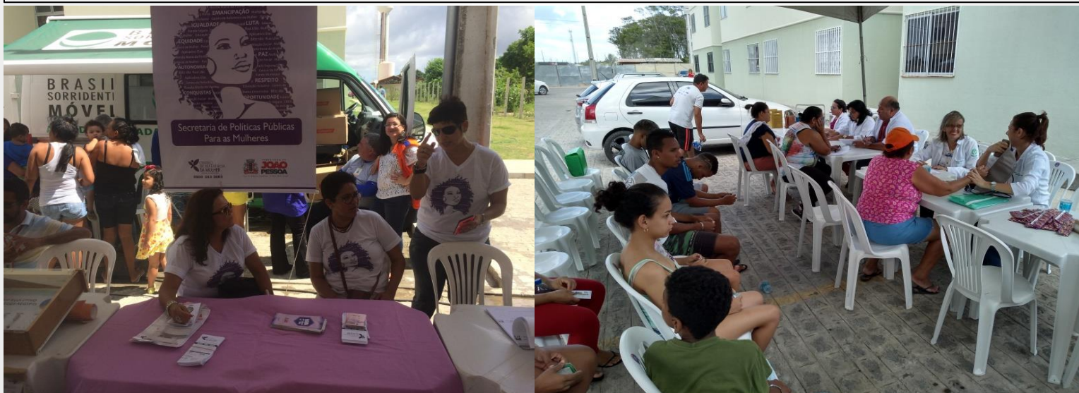
Ação Cidadania em parceria com SPPM e CRAS Gervásio Maia, arquivo 2018.