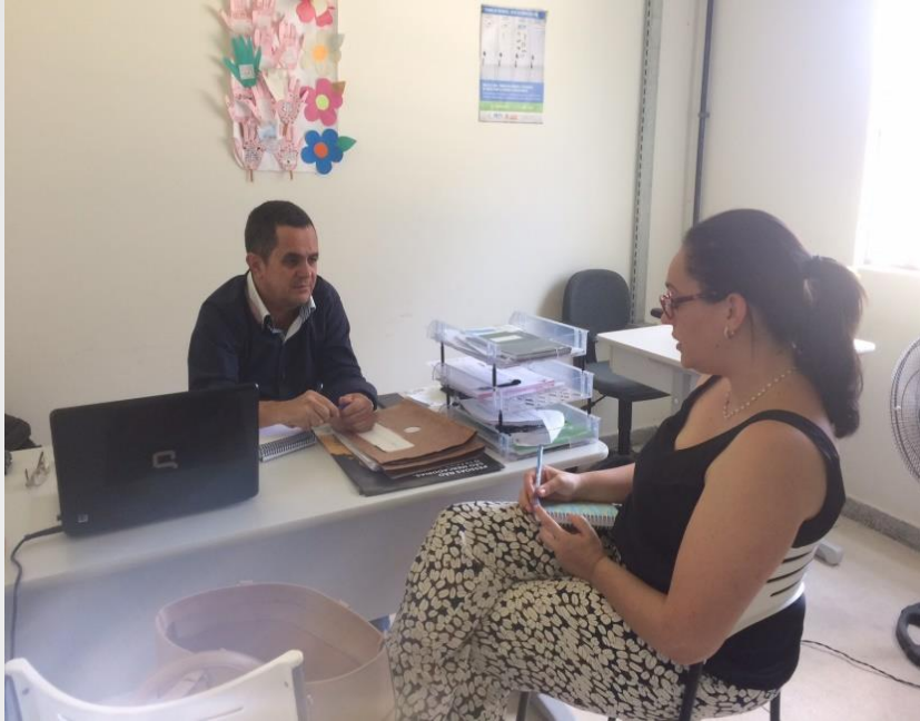
Articulação Institucional com o CRAS Gervásio Maia, arquivo 2018.