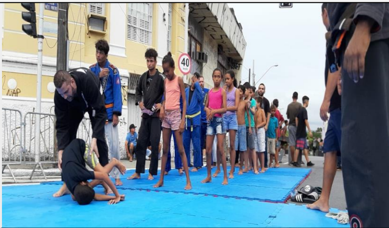
Oficina de Jiu-Jitsu no Centro Histórico , arquivo 2019.