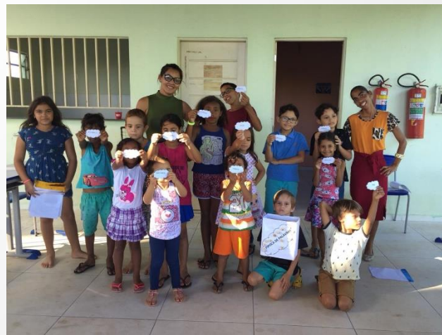
Oficina de Leitura, arquivo SEMHAB – 2019.